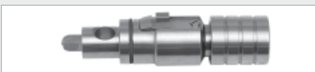
227-100-003 Dyonics EP 1